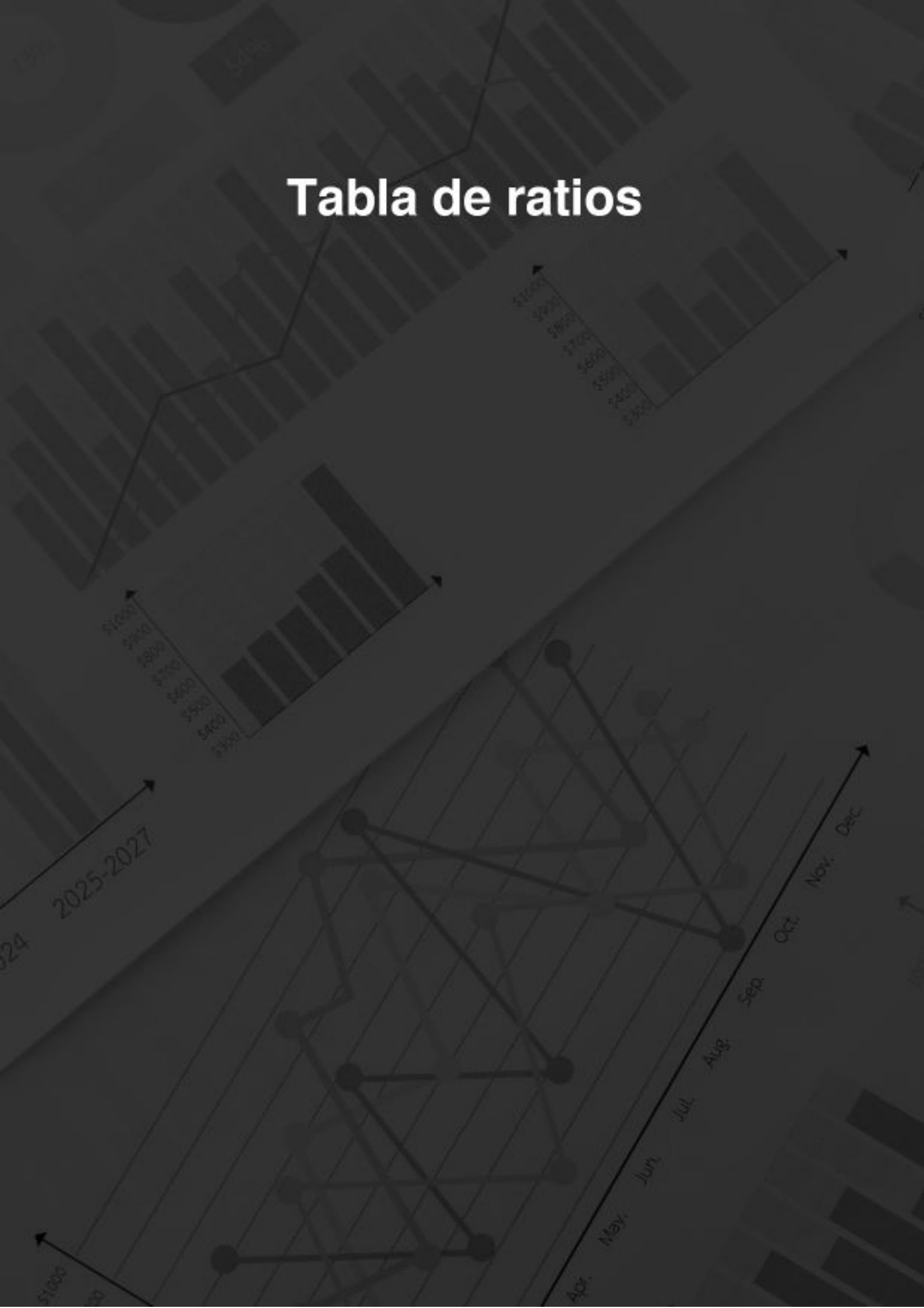
Tabla de ratios